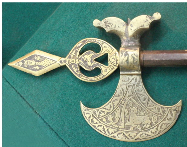
Рис. 7. Табарзин (топор) из коллекции Астраханского краеведческого музея