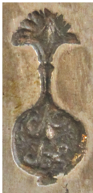
Рис. 2. Клеймо на клинке кинжала кама из этнографического собрания Музея антропологии МГУ