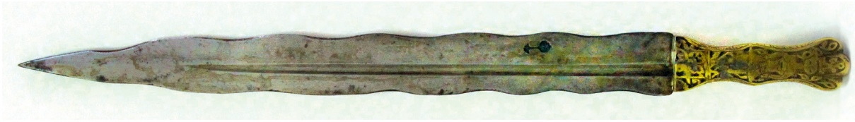
Рис. 1. Кинжал кама из этнографической коллекции Музея антропологии МГУ

ского музея; около 5000 предметов из Государственного музейного фонда; экспонаты из Военно-исторического музея и из Строгановского училища [Ипполитова, 2001, с. 145].