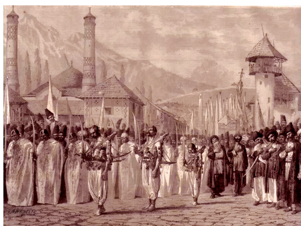
Рис. 8. В.В. Верещагин. Религиозная процессия на празднике Мохаррем в Шуше. 1865. Бумага, черный и итальянский карандаши, белила, растушка. 72x 91,5. ГТГ