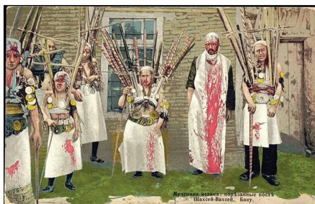
Рис. 9. Мученики ислама: порезанные после Шахсей-Вахсей. Баку. Открытка начала XX в.