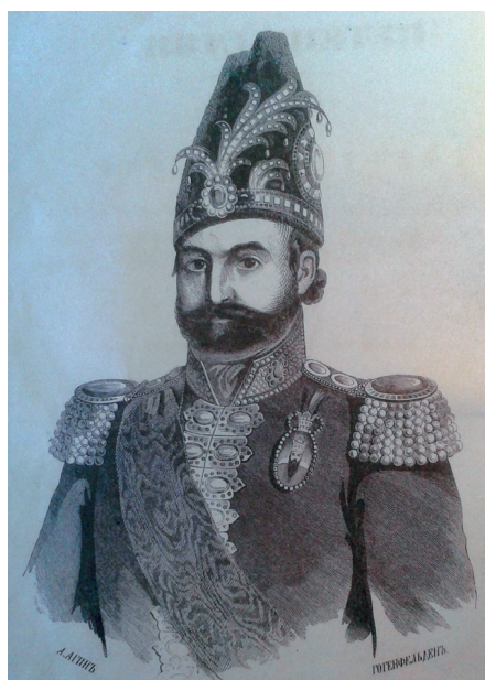
Рис. 10. Мохаммед шах Каджар (Березин И.Н. Путешествие по Северной Персии Ильи Березина. С портретом Мухаммеда Шаха, планами и видами замечательных мест Казань: Типография губернского правления и университетская, 1852)