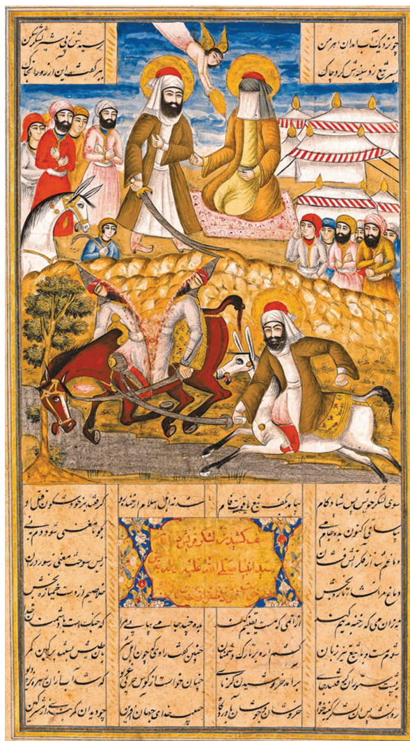
Рис. 5. Фолио из Хараваннаме. Али разрубает врага в Битве у рва. Коллекция Аймана Джовани (The Image of the Prophet between Ideal and Ideology. Christiane Gruber, Avinoam Shalem (Eds). Berlin: De Gruyter, 2014. Pl. 29).