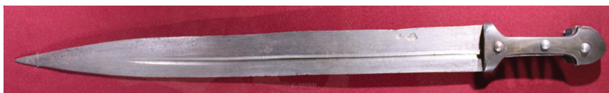
Рис. 4. Кинжал кама из собрания Астраханского краеведческого музея