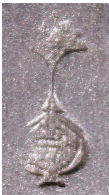
Рис. 3. Клеймо на клинке кинжала кама из собрания Астраханского краеведческого музея